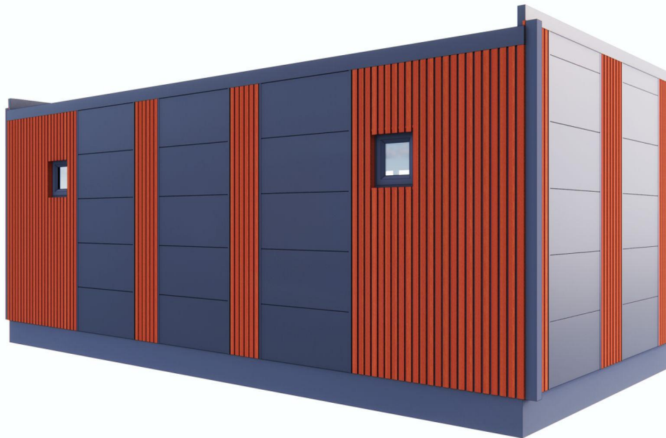
Zadnja strana pogled 2