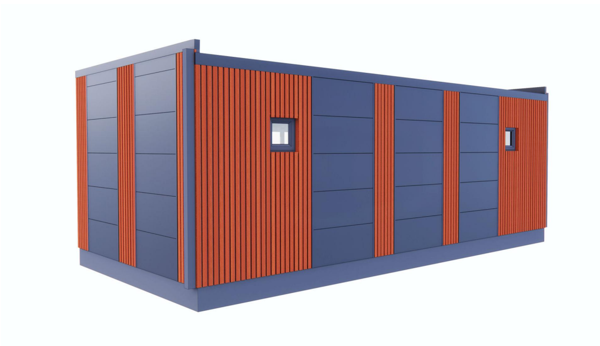
Zadnja strana pogled 1