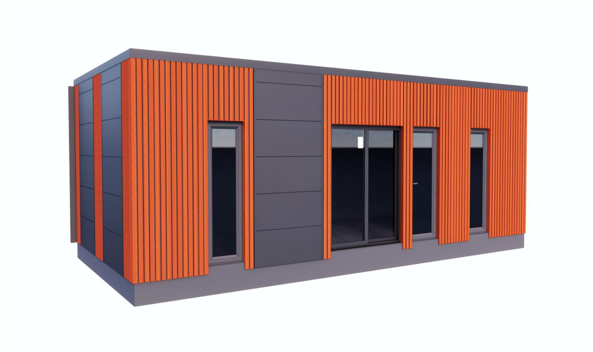
Prednja strana pogled